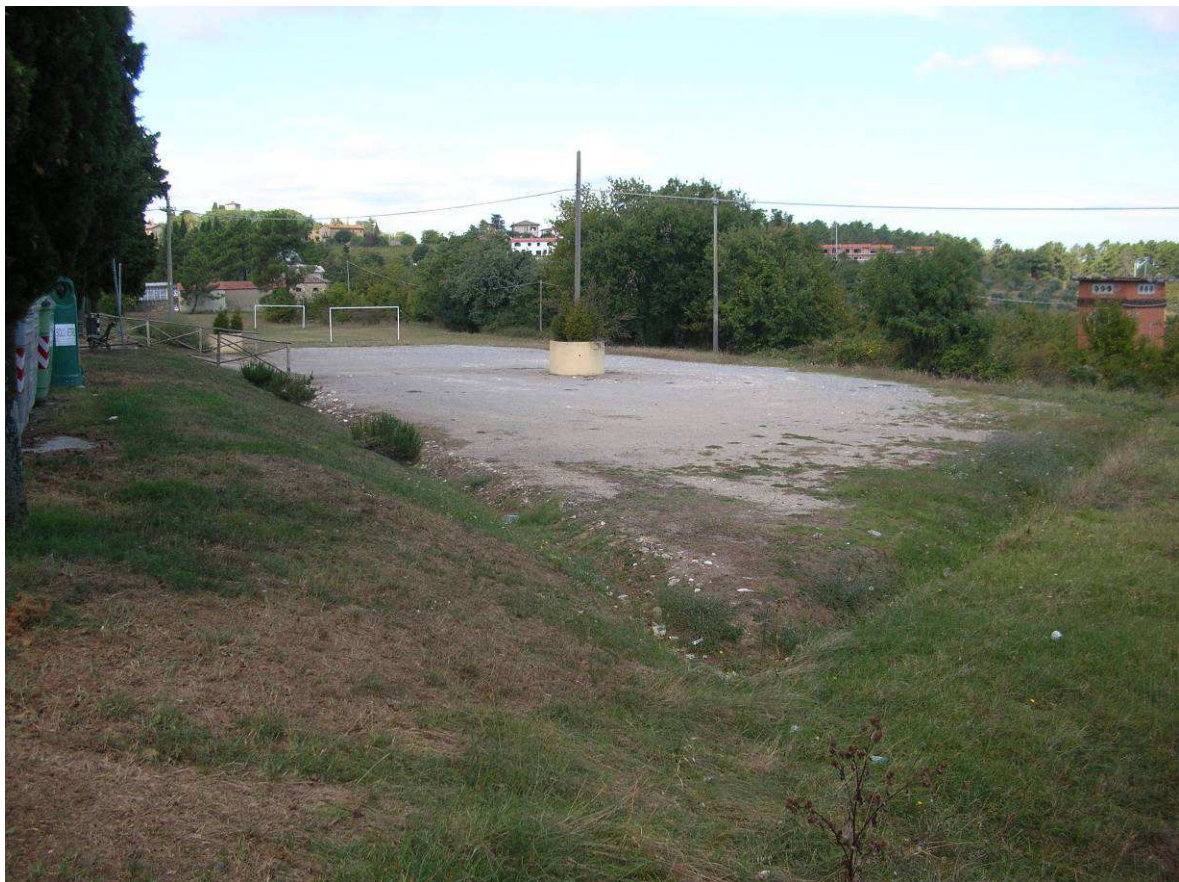
Area Ricovero Popolazione: Parcheggio Palazzuolo